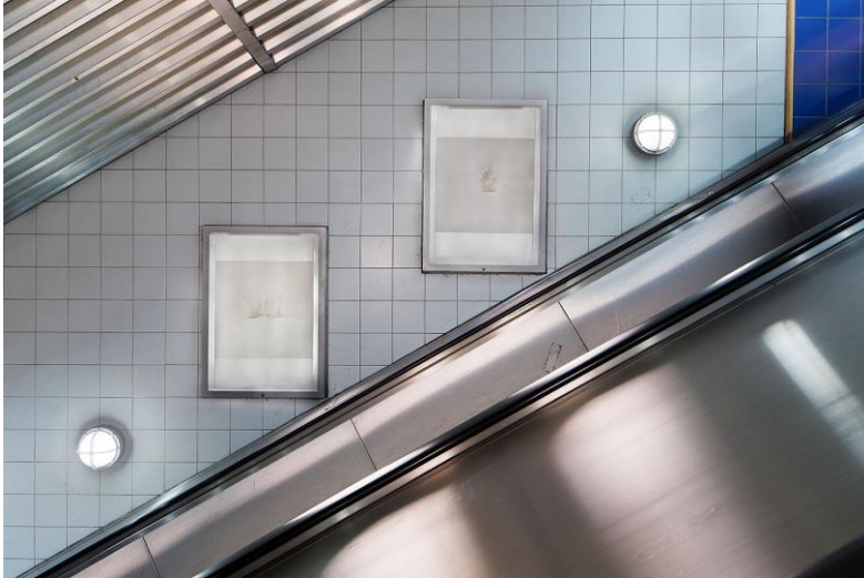
Ljustavlor Light boxes