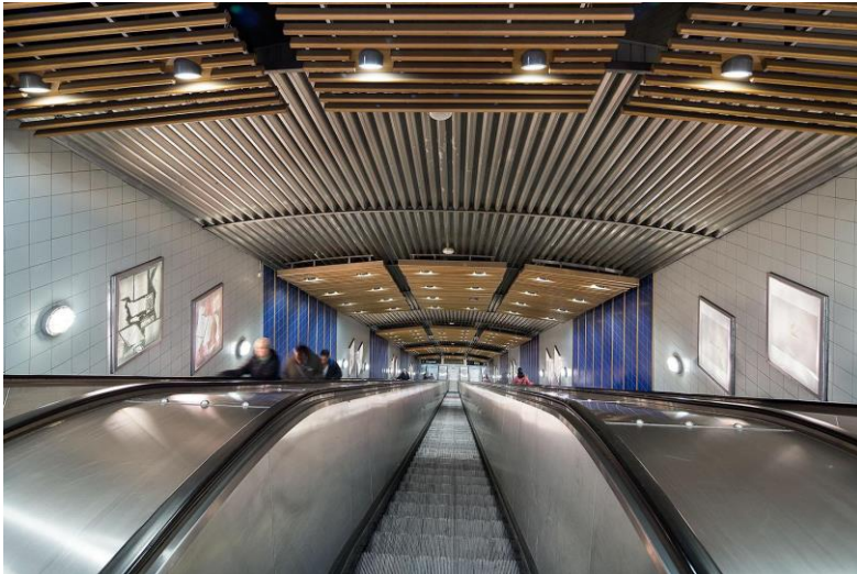
Ljustavlor Light boxes