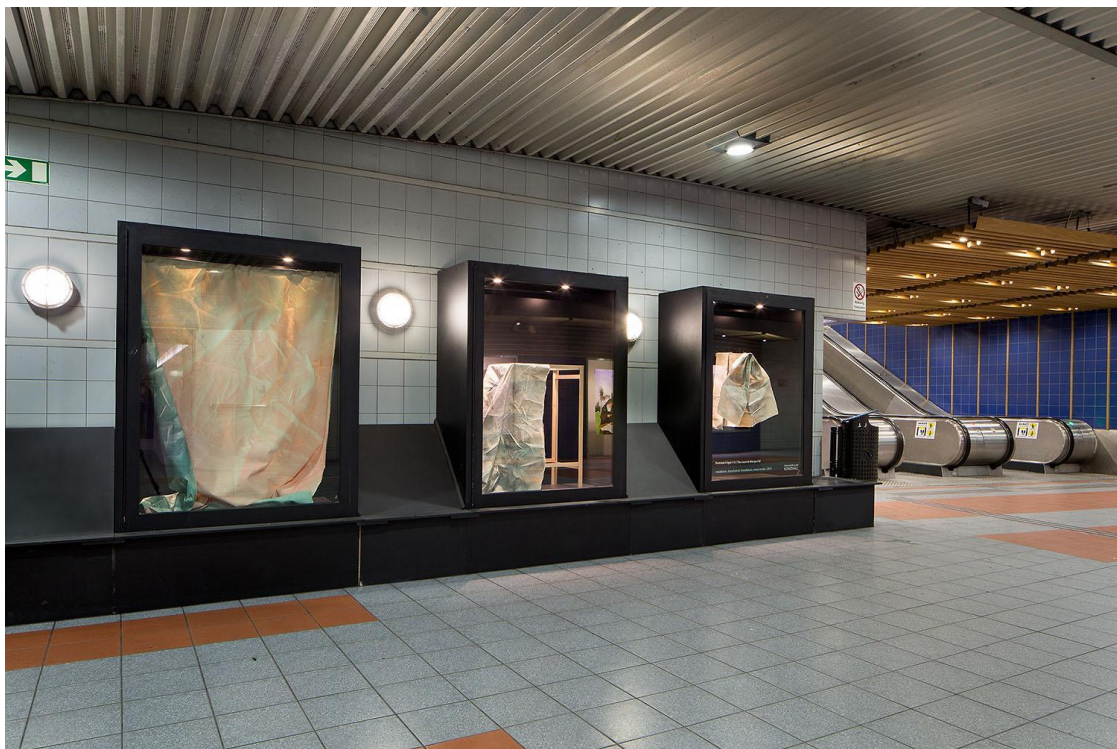
3 svarta boxar 3 black boxes